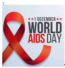
Il virus HIV e l'AIDS.

Cap. 7. L'antropocene, l'olocene, Charles Gordon Hewitt, l'ecologia, gli organismi e l'ambiente, le catene alimentari, i livelli trofici, i cicli biogeochimici del carbonio, dell'azoto e del fosforo, l'eutrofizzazione, la perdita della biodiversità, le specie aliene, la pesca eccessiva, gli inquinanti (il DDT), il bioaccumulo e la biomagnificazione, le geosfere, l'atmosfera, il clima, i gas serra, i cambiamenti climatici, il riscaldamento globale, gli accordi sul clima (da pag. 167 a pag. 188).