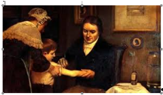
Edward Jenner: il padre dei vaccini.